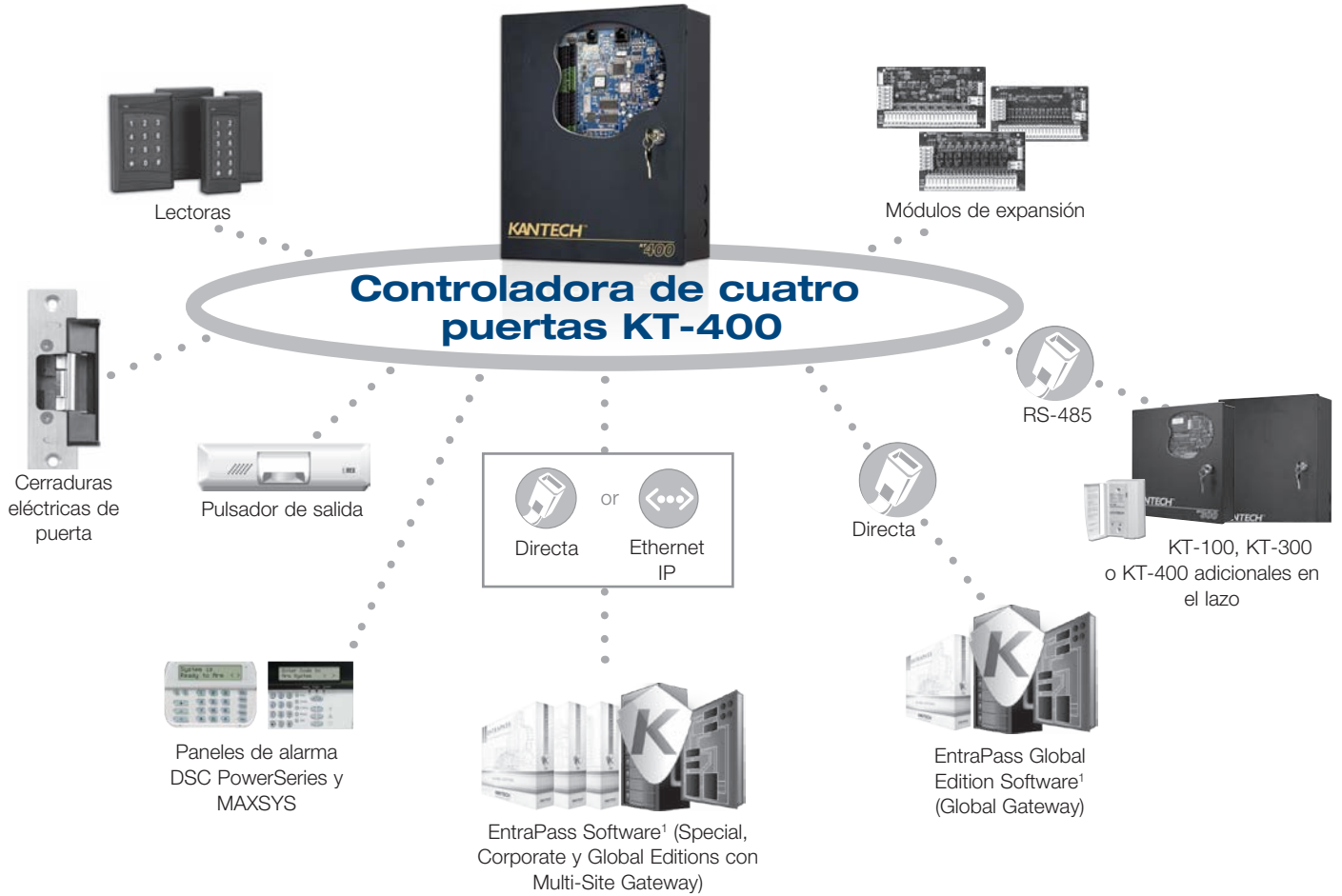
Diagrama básico del sistema